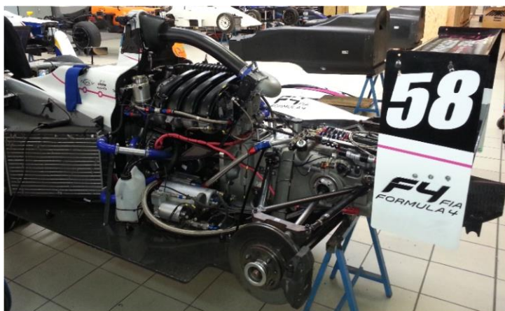
Intégration du moteur Renault F4 dans le châssis Mygale.

Mygale et Renault Sport travaillent conjointement pour donner naissance à la toute première F4 100 % française, Made in Magny-Cours.